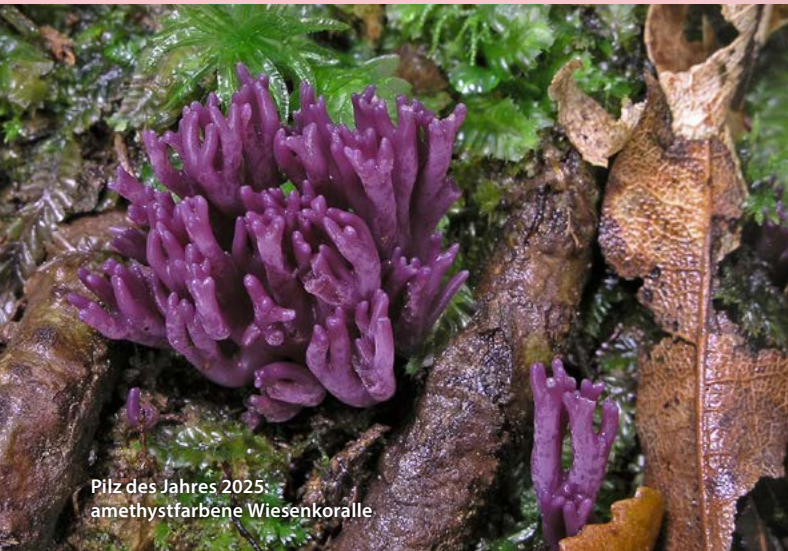
Pilz des Jahres 2025: amethystfarbene Wiesenkoralle